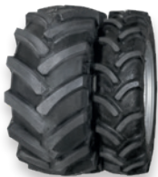
AS MPT-01 + RJ 9.5R24"