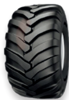
AS Flotation 331