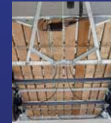
Fahrgestell & Boden

Die Liebe zum Detail bei allen Ifor Williams Anhängern macht unsere Produkte so beliebt bei ihren Besitzern. Werfen Sie doch einen Blick auf unsere Standard-ausstattung.