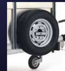
Reserverad und Halter

Die Modelle mit 1,22 m Kopfhöhe sind mit einer einzelnen Tür für schnellen einfachen Zugang ausgestattet. Die geteilte Tür bei den 1,83 m und 2,13 m Modellen ermöglicht getrennten Zugang zum unteren und oberen Deck.