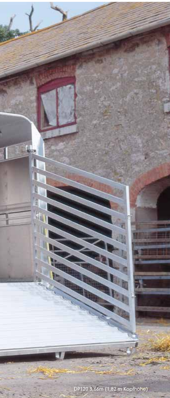
DP120 3,66m (1,82 m Kopfhöhe)