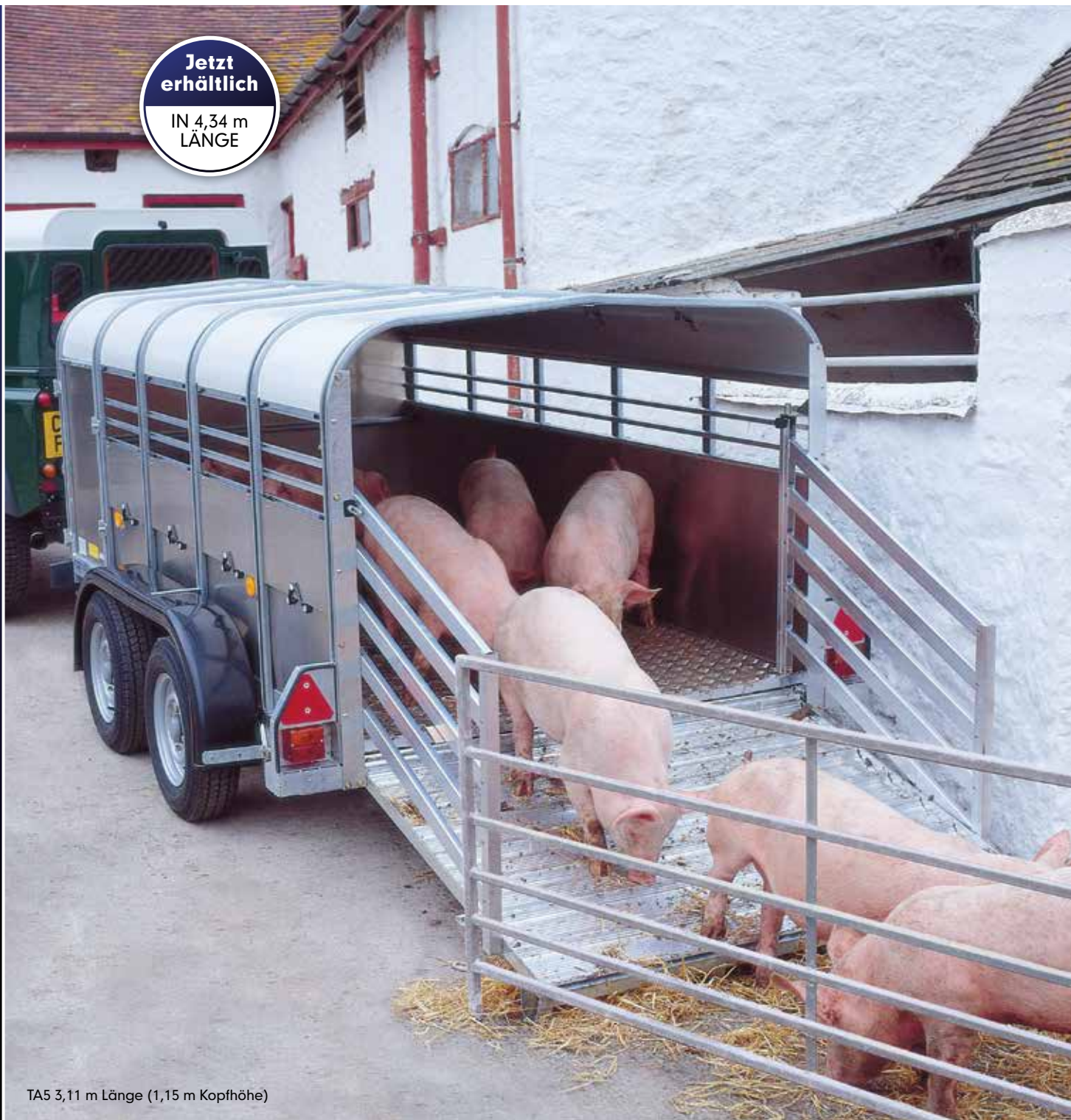
TA5 3,11 m Länge (1,15 m Kopfhöhe)