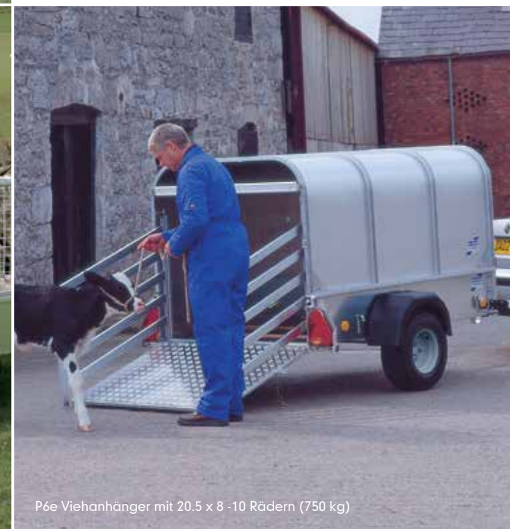
P6e Viehanhänger mit 20.5 x 8 -10 Rädern (750 kg)

Angaben zum Leergewicht finden Sie auf Seite 10 Angaben zum max. Bruttogewicht und Reifen auf Seite 14