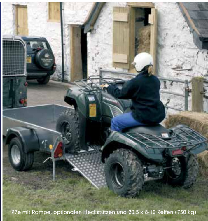
P7e mit Rampe, optionalen Heckstützen und 20.5 x 8-10 Reifen (750 kg)

Weitere Varianten des P6e und des P7e sind erhältlich.