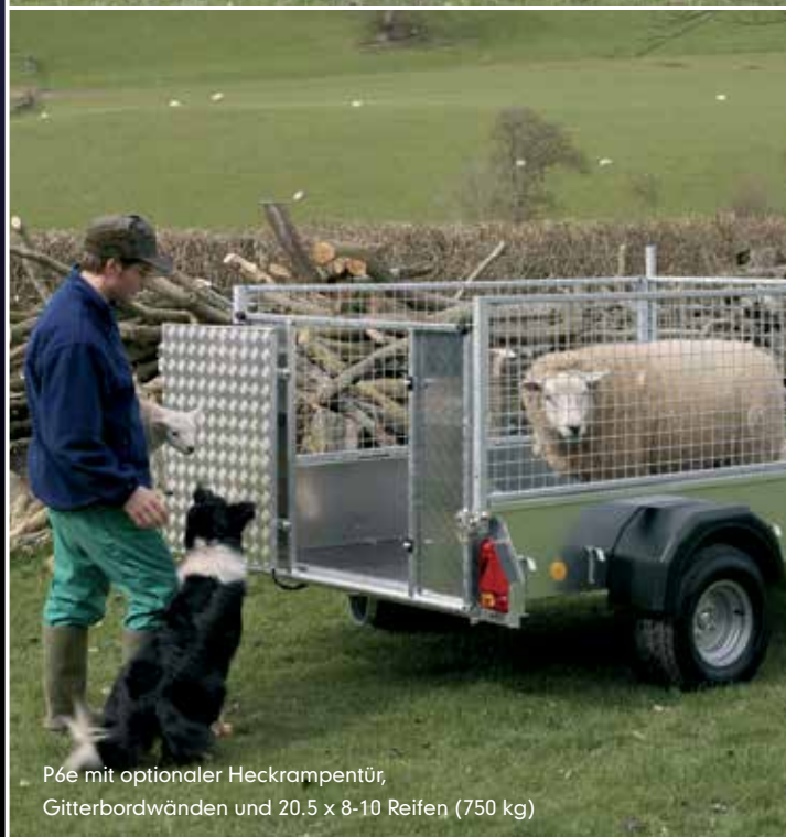
P6e mit optionaler Heckrampentür, Gitterbordwänden und 20.5 x 8-10 Reifen (750 kg)