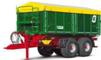
TKD 302 (20-24 t Gesamtgewicht)