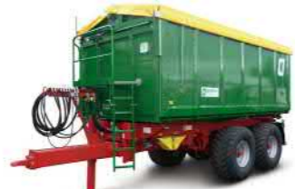
TKD 302-S (20-24 t Gesamtgewicht)