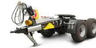
TAD 22 (22 t Gesamtgewicht)