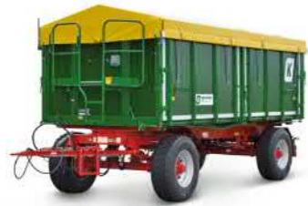
HKD 302 (18 t Gesamtgewicht)