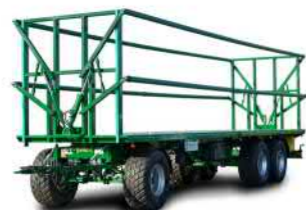
PWO 24 (24 t Gesamtgewicht)