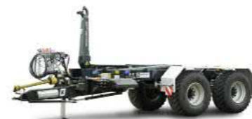
THL 20 (20-24 t Gesamtgewicht)