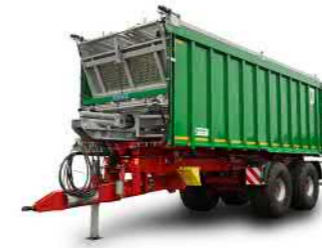
TAW 20 (20-24 t Gesamtgewicht)