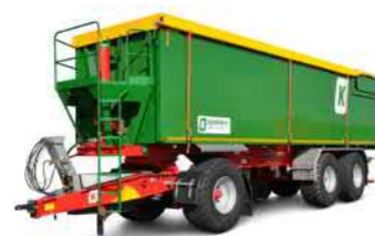
TMR 34 (34 t Gesamtgewicht)