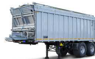
SAW 32 (32 t Gesamtgewicht)