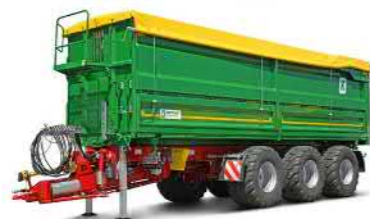
MUK 402 (31-34 t Gesamtgewicht)