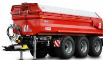
MUP 30SP (31-34 t Gesamtgewicht)