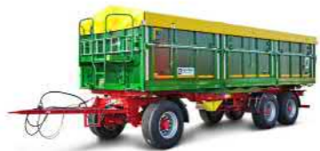
HKD 402 (24 t Gesamtgewicht)