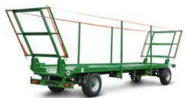
PWO 18 (18 t Gesamtgewicht)