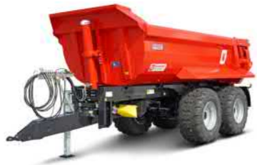
MUP 20HP (20-24 t Gesamtgewicht)