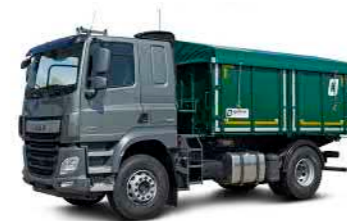
ZKA 1 (16 t Gesamtgewicht)