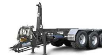
THL 30 (31-34 t Gesamtgewicht)