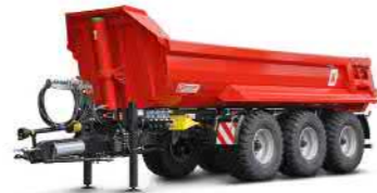
MUP 30HP (31-34 t Gesamtgewicht)