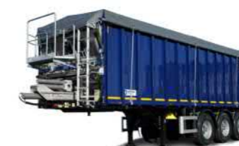
SAW 36 (36 t Gesamtgewicht)