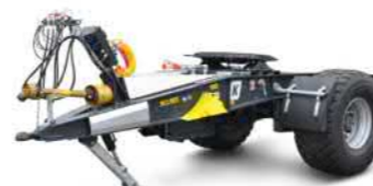
EAD 14 (14 t Gesamtgewicht)