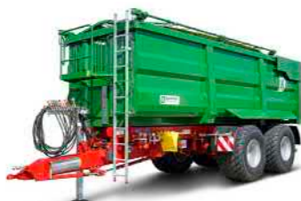
MUK 303 (20-24 t Gesamtgewicht)