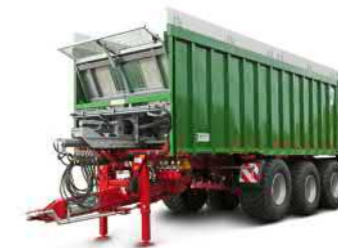
TAW 30 (31-34 t Gesamtgewicht)