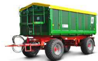
HKD 302-S (18 t Gesamtgewicht)