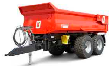
MUP 20SP (20-24 t Gesamtgewicht)