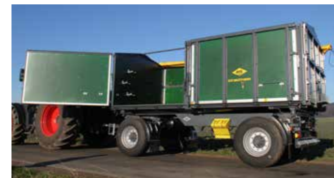
Technische Änderungen vorbehalten, Ausstattung und Optionen gemäß Tabelle S. 19

Die Langhebelverschlüsse ermöglichen ein bequemes und sicheres Öffnen und Schließen der Bordwände mit äußerst geringem Kraftaufwand.