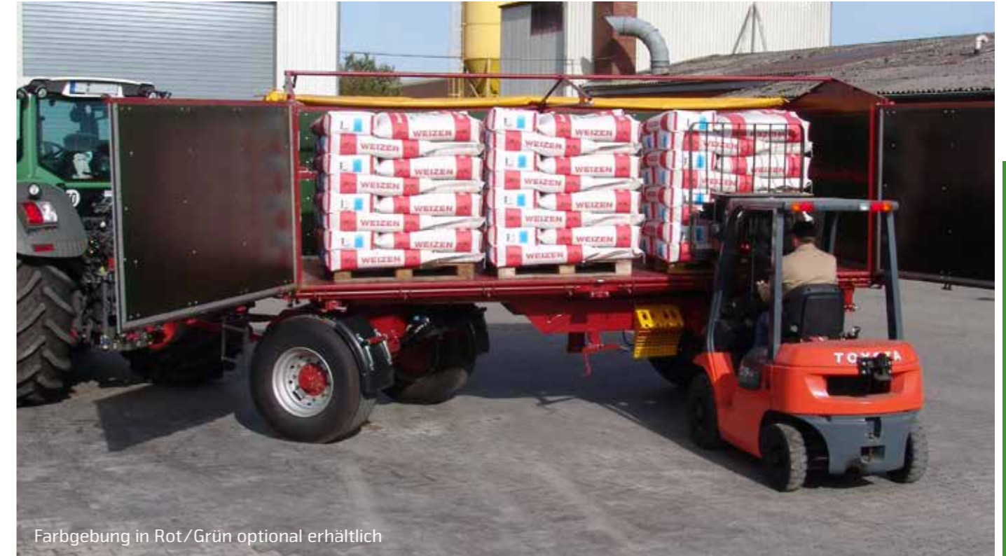
Farbgebung in Rot/Grün optional erhältlich