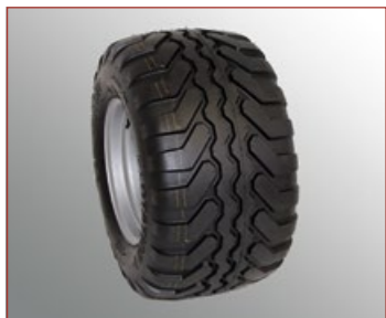
Vredestein Flotation+ 480/45-17", Largeur 480 mm, Diamètre 850 mm