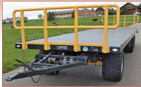
Grilles avant/arrière enfilées ou vissées