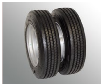
Jumeaux 215/75R17.5", Largeur des pneus 220 mm, Diamètre 780 mm