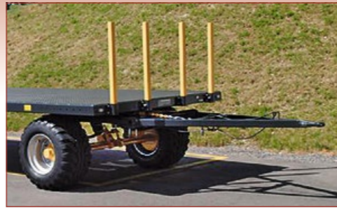
Ranchers enfilables 85 cm, en option avec rallonges jusqu'à 240 cm