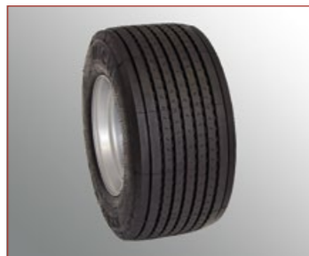
445/45R19.5", Largeur 460 mm, Diamètre 910 mm