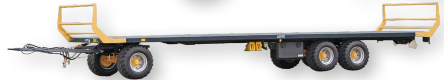
Remorque à plateau TABA pour un poids total jusqu'à 24'000 kg

La remorque à plateau est d'une finition haut de gamme – véritablement SWISS MADE!