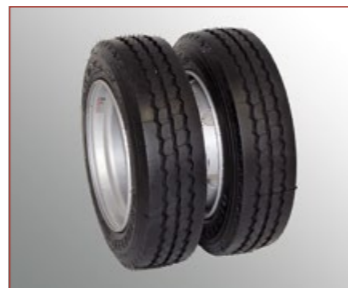
Jumeaux 205/65R17.5", Largeur des pneus 215 mm, Diamètre 710 mm