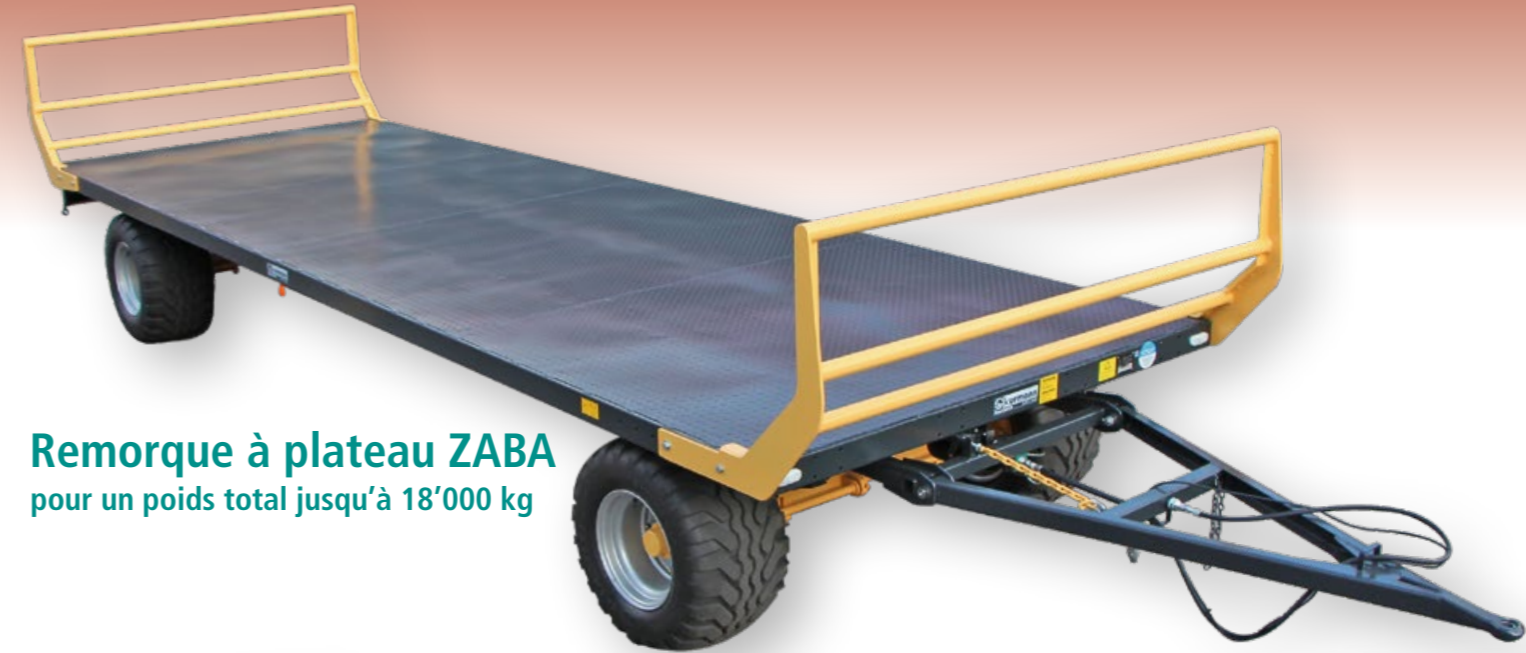
Remorque à plateau ZABA pour un poids total jusqu'à 18'000 kg