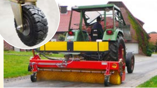
Geeignet für den Traktor im Heck- und Frontanbau