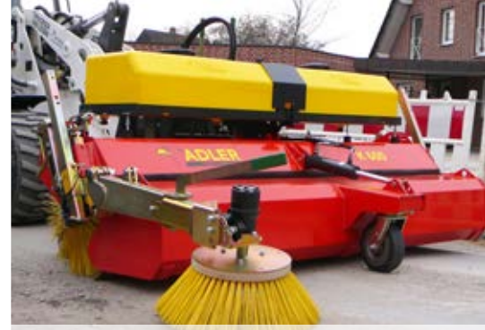
Seitenkehrbesen und Wassersprüheinrichtung als Option