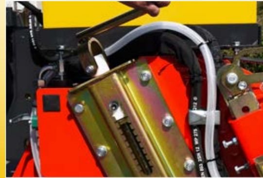
Bürste stufenlos einstellbar